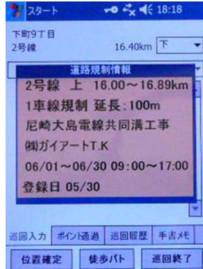
道路規制情報の確認