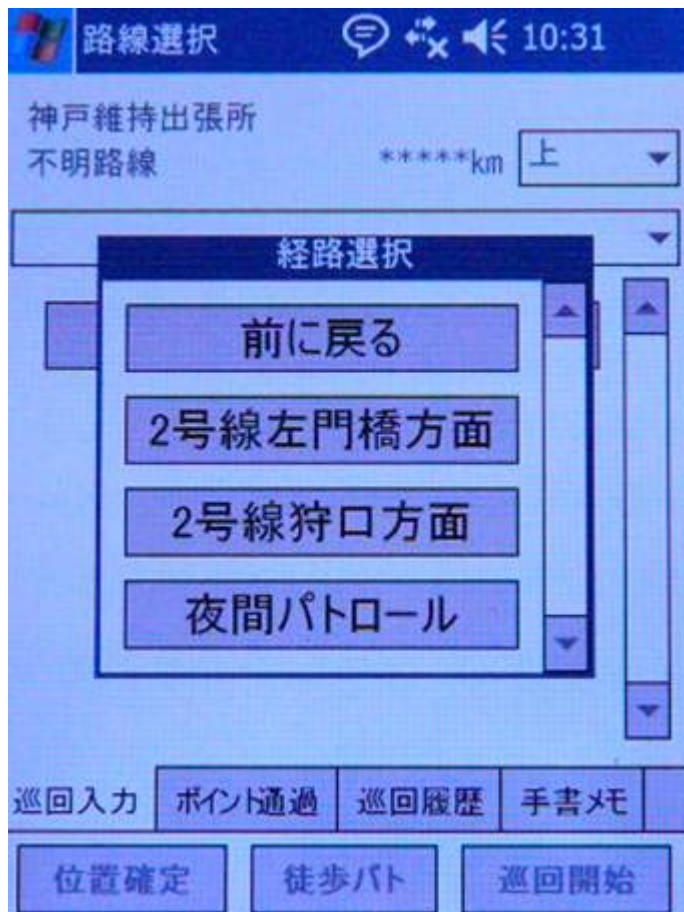
路線選択(パトロール開始)